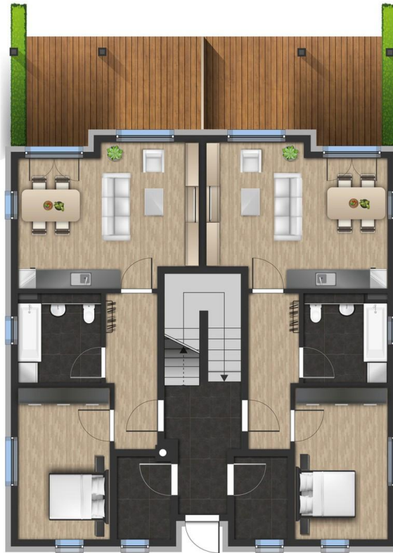
EG 2 x 2 Zimmer Whg ca. 57 m 2