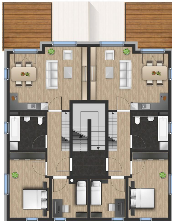
OG 2 x 3 Zimmer Whg ca. 60m 2